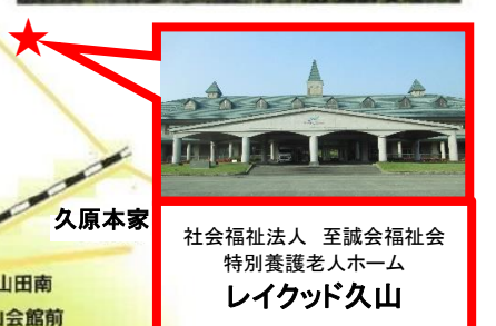
社会福祉法人 至誠会福祉会 特別養護老人ホーム レイクウッド久山